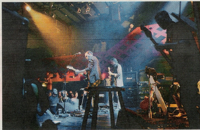
Pink Floyd Project består af ti mand, der hver især behersker deres instrument til fuldkommenhed på de album-tro versioner af klassikerne. Eneste lille anke var et svagt haltende kor.

til skamme ved fredagens tilbristepunktet udsolgte koncert med Pink Floyd Project i Støberihallen. Bandet spillede samme sted forrige år, og det