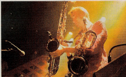
Saxofonen er et af de mere upågtede instrumenter hos Pink Floyd - men den spiller en væsentlig rolle i enkelte numre...

Og numrene? De kom hele vejen rundt. Hele Wish You Were Here-albummet blev spillet, og der blev selvfølgelig også givet en række af de største hits: Ballet åbnede med Learning to Fly, og allerede andet nummer var Another Brick in the Wall. Og dermed var succesen allerede halvvejs i hus.