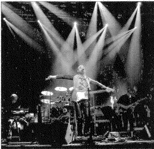
The Pink Floyd Project er blevet kaldt "verdens bedste Pink Floyd-cover-band". Her fra koncertstedet "Trommen" i Hørsholm.

Ideen med The Pink Floyd Project var at genskabe musikken fra den turné, der blev Pink Floyds sidste